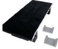
ComPlus frame mid section